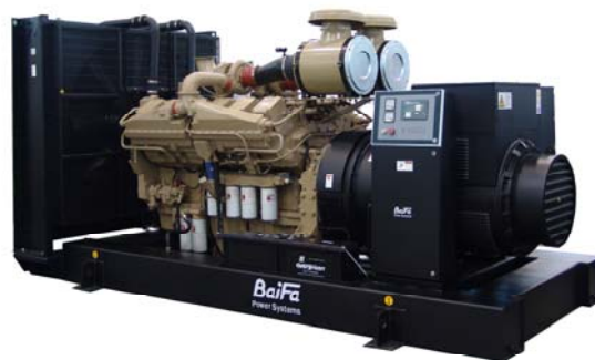
机组外形, 仅供参考