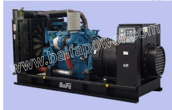
机组外形, 仅供参考