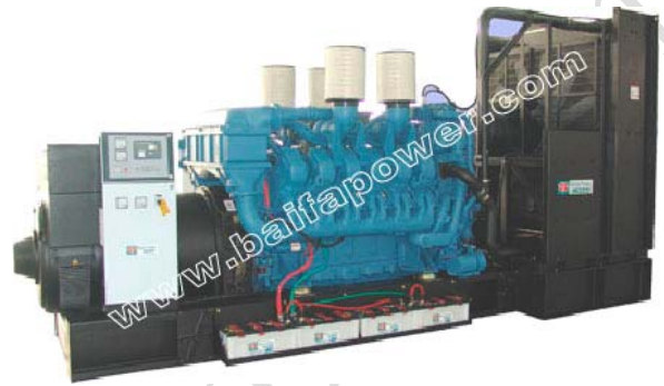
机组外形, 仅供参考