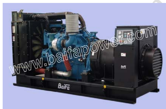
机组外形, 仅供参考